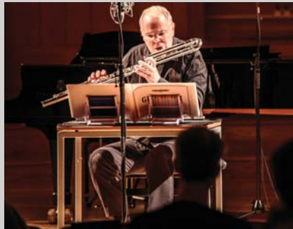
Festival Slowind, stran 34