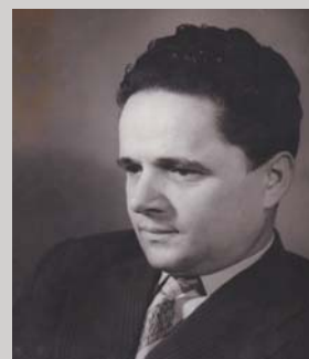
Avdo Smailović, skladatelj, stran 18