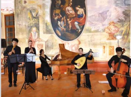
SEVIQC Brežice, stran 12