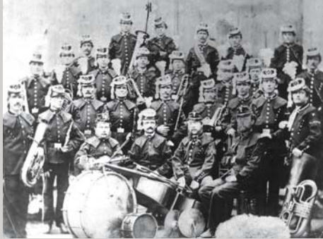
Pogled v glasbo – z godbo na pihala, stran 23