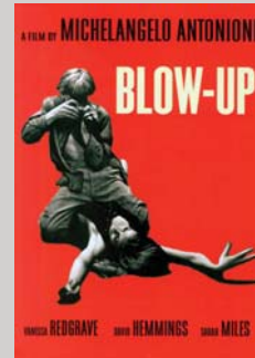
Tišina, snema se JAZZ! stran 40