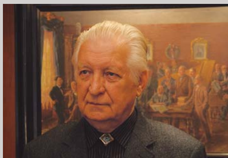
80 let skladatelja Pavla Mihelčiča, stran 20