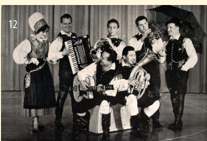
ORIGINAL OBERKRAINER QUINTETT AVSENIK