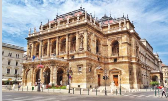
Budimpešta, mesto glasbe, stran 16