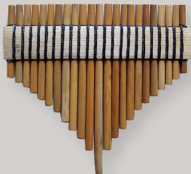
Poglejmo v glasbo – s slovenskimi ljudskimi glasbili, stran 23