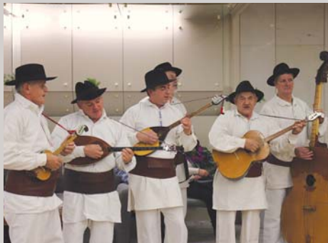
Slovenska zemlja v pesmi in besedi, stran 12