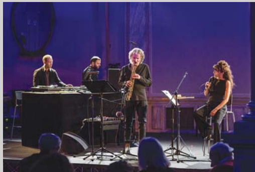
Beneški bienale, stran 27