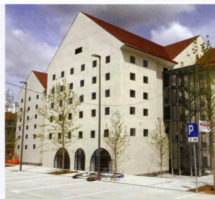
Prenovljena Cukrarna