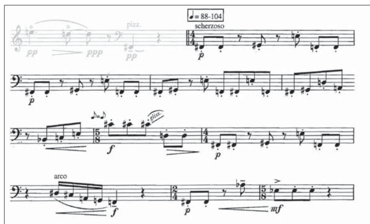
Slika 4 pizzicato del

Drugi ritmični del z oznako scherezoso prinaša nekaj že znanega gradiva iz prvega ritmičnega odseka, ta pa je na mestih spremenjen – v inverziji –, permutiran. Odsek ima začetni, vmesni in zaključni »novi« del. Najprej se pojavi tih pizzicato , ki mu sledi ponovitev že znanega gradiva. Za tem nastopi že omenjeni cantando , po krajšem prehodu, v katerem spet zasledimo Fibonaccijevo zaporedje, pa sledi še virtuoso , kjer lahko spremljamo igranje dvojemk, združeno s hitrimi menjavami strun.