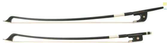
Nemška in francoska varianta loka za kontrabas???