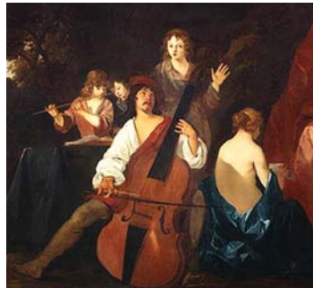
Slika starinskega kontrabasa

Kontrabas se je tako kot preostali člani družine godal pojavil v zgodnjem 16. stoletju, do današnjih dni pa je zamenjal kar nekaj oblik, uglasitev in števil strun. Inštrument podobne velikosti in oblike se je prvič pojavil leta 1493 v Italiji, kljub temu pa je večini raziskovalcem, ki se ukvarjajo z zgodovino kontrabasa, pomembnejši razvoj njegove uglasitve. Ta se je skozi zgodovino velikokrat spremenila, še danes pa poznamo dve – orkestrsko E'-A'-D-G